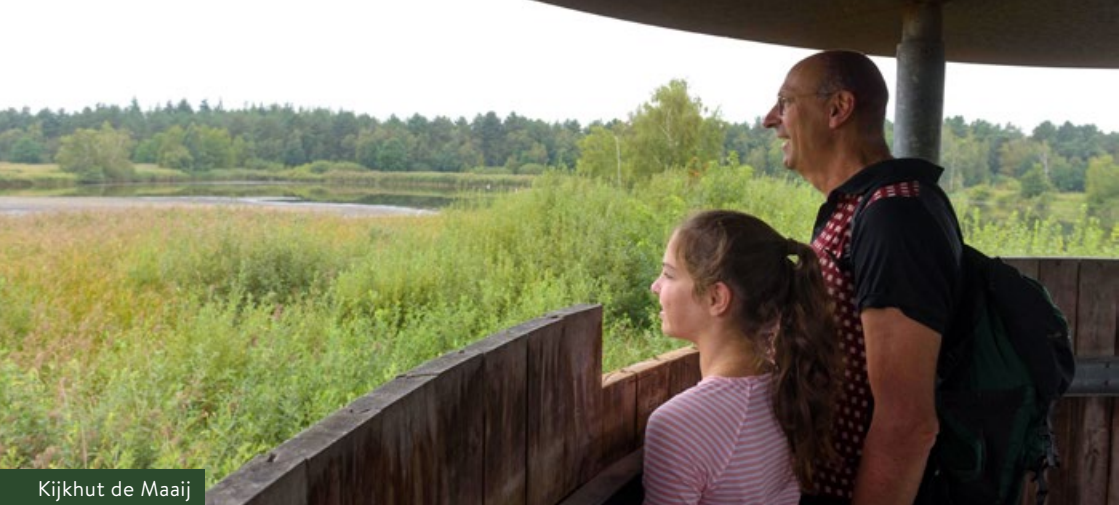
Kijkhut de Maaij